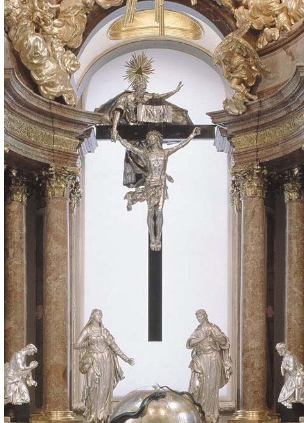
Christus – Hoffnung Europas Mittleuropäischer Katholikentag 2003/2004